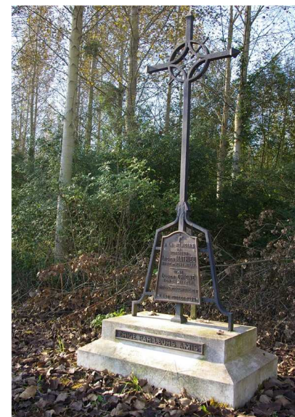
Stèle en souvenir de Monsieur Lucien Mathieu. CD 43 en face de la scierie