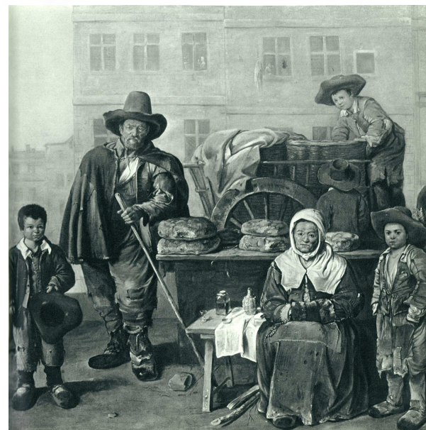
Tableau de Michelin